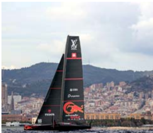
Alinghi fait partie des nouveaux partenaires de la Coupe de l'America.

Mais dans la continuité d'annonces récentes visant à moderniser l'image de la course – équipement mixte, plafonnement des budgets à 75 millions d'euros par campagne – le «Defender» Team New Zealand a détaillé hier de nouveaux engagements. Pour une meilleure visibilité, l'épreuve reine devient officiellement biennale à partir de l'édition 2027, qui aura lieu à Naples.